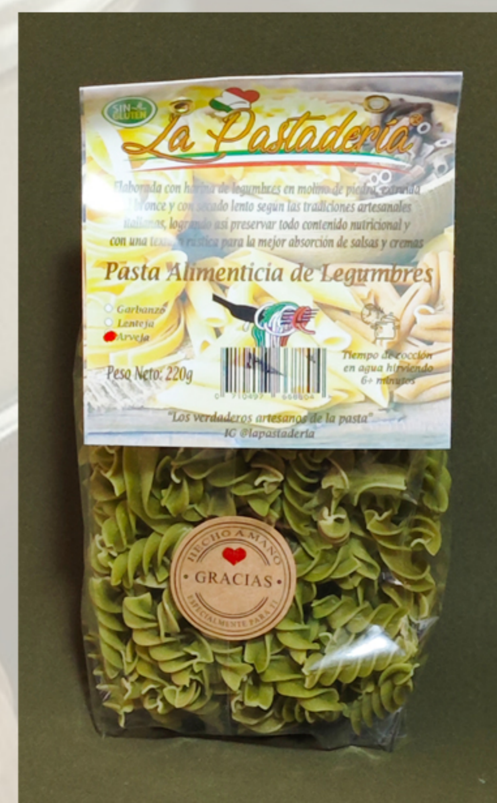
Fusilli de arvejas