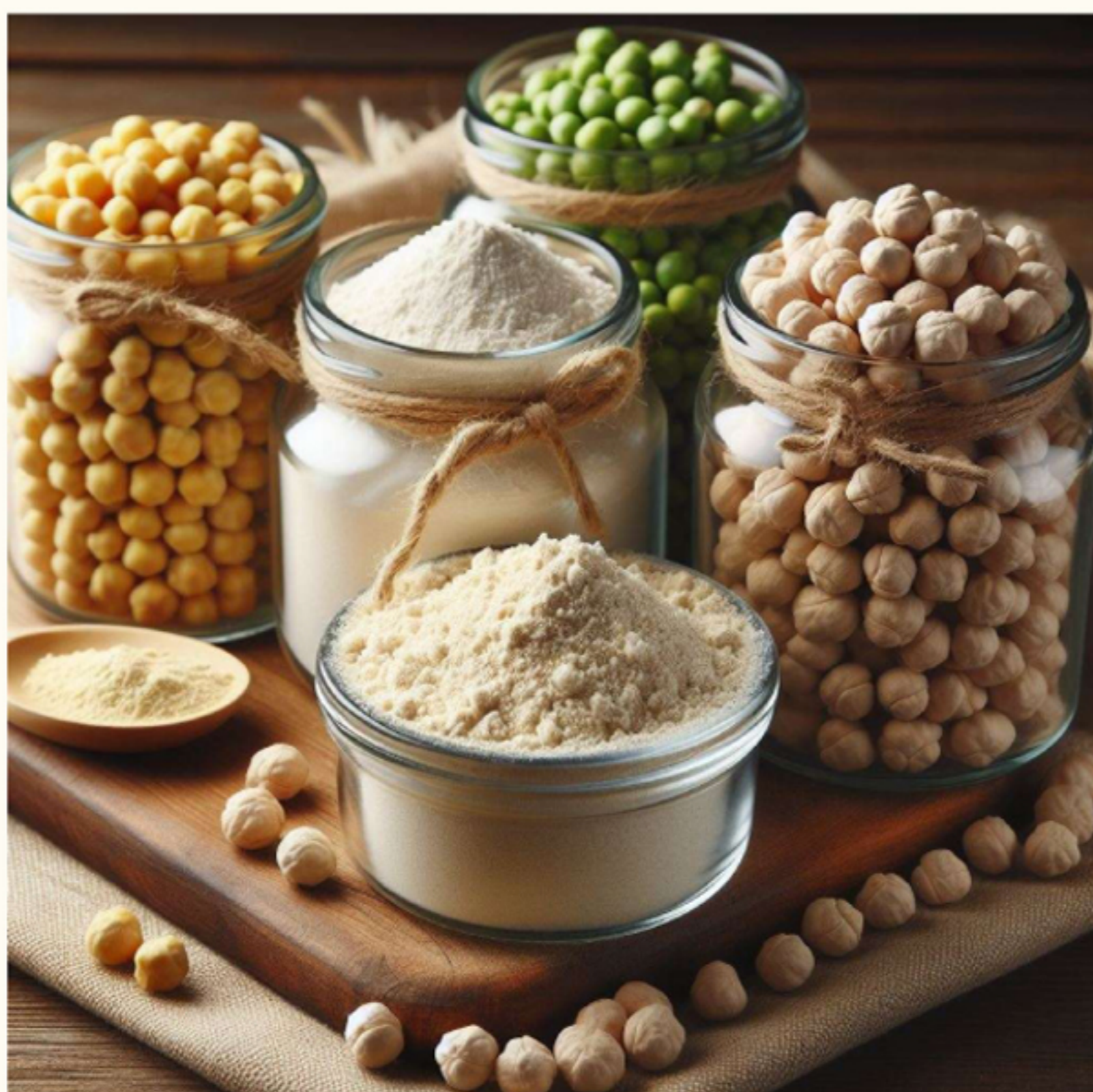
Harinas de legumbres

NUESTRO OBJETIVO ES HACER PASTAS SIN GLUTEN Y DE ALTO VALOR PROTEICO, PARA CONTRIBUIR EN TU ALIMENTACION Y SALUD, CON CALIDAD CERTIFICADA