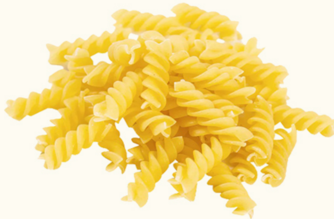
Fusilli o Tornillitos