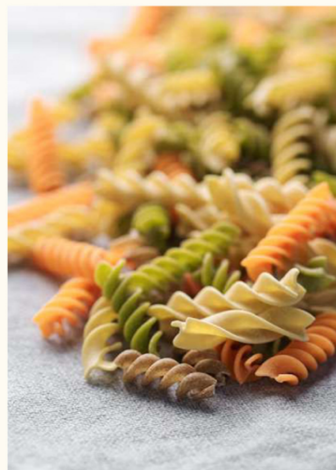
Pastas sin gluten de harinas de Legumbres