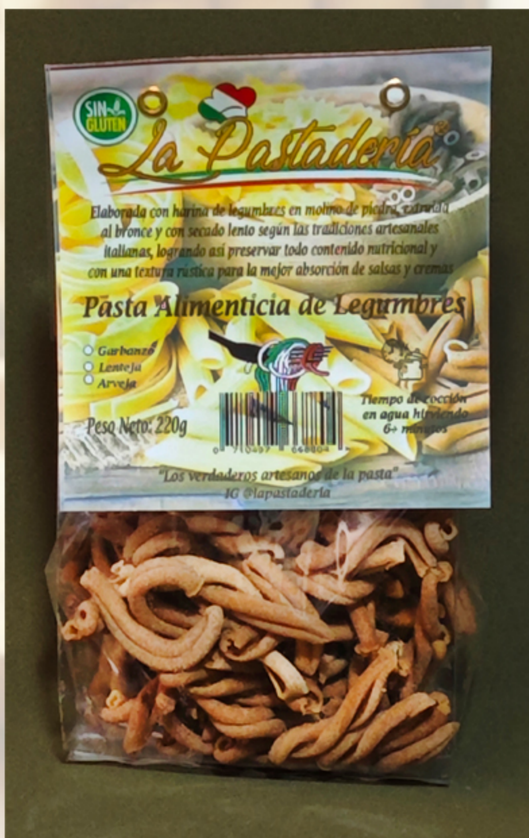
Casarecce de lentejas

Apta y recomendada para el consumo de personas celíacas, intolerantes al gluten, diabéticos, personas con obesidad morbida, pacientes con intervención bariátrica, personas de la tercera edad, personas con neurodiversidad, deportistas y personas que quieren comer saludablemente.