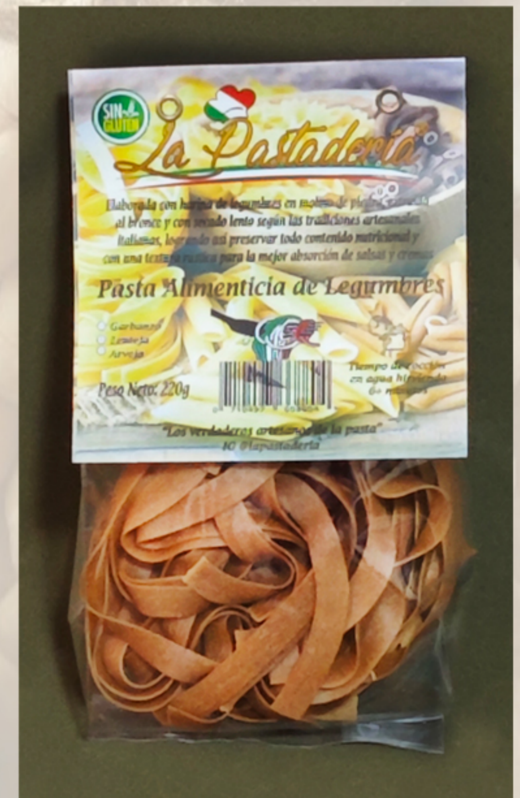
Fettucine de lentejas