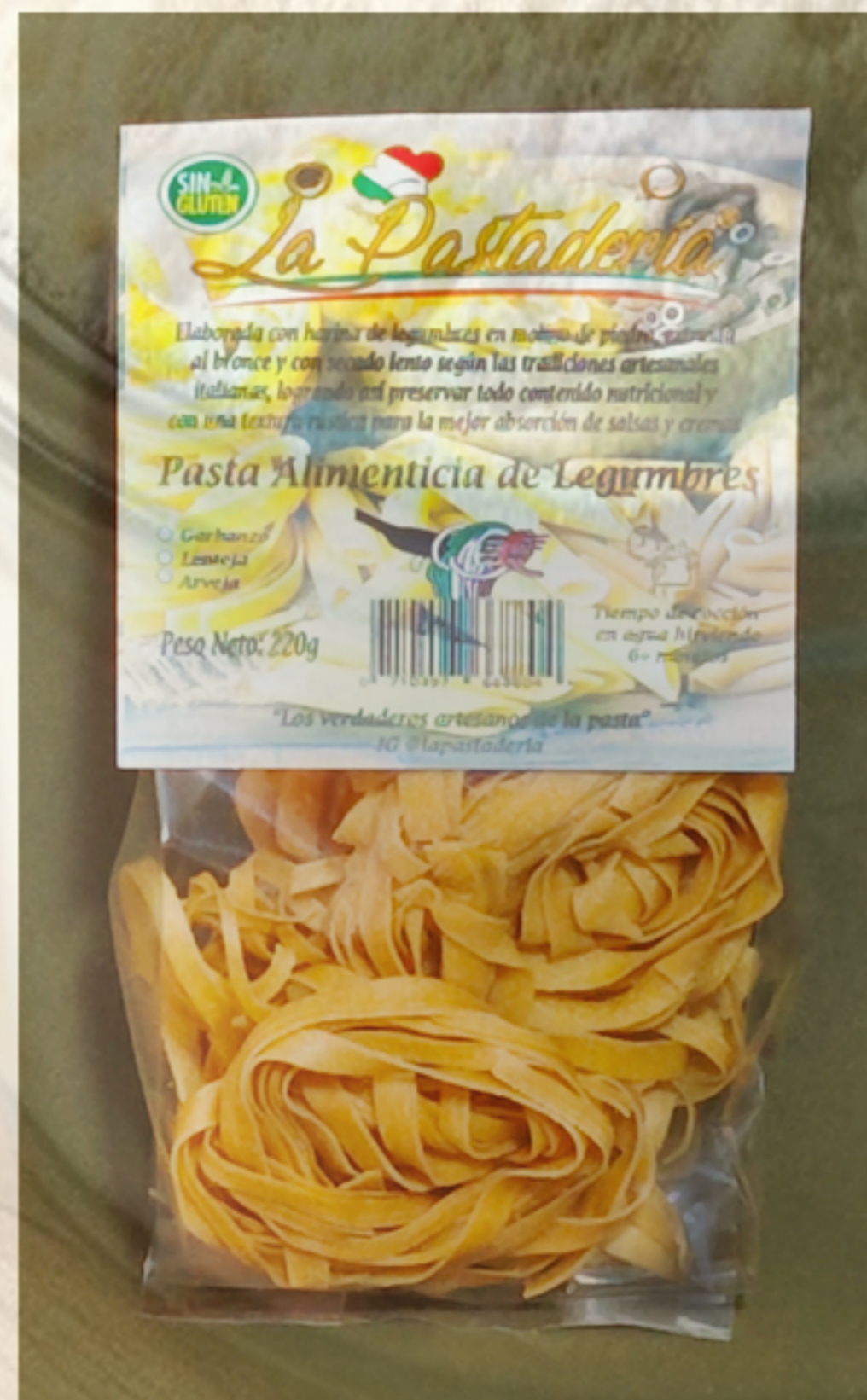
Fetuccine de garbanzos