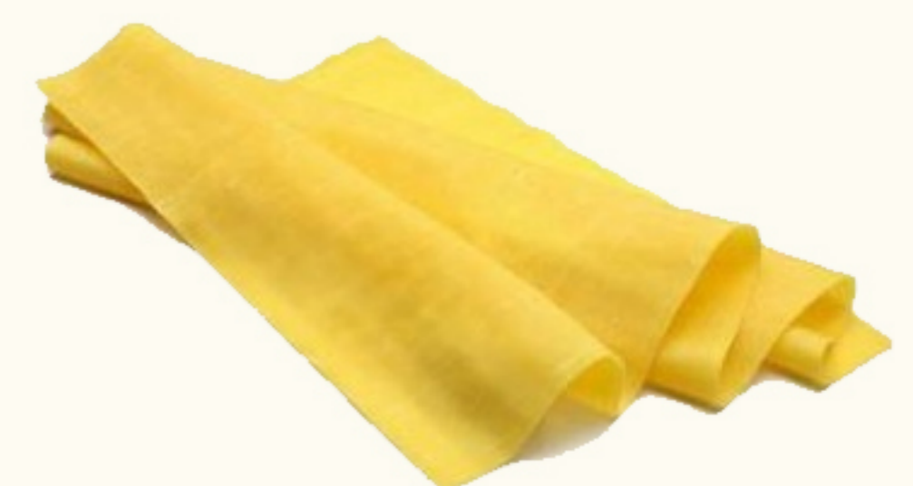
Pasta Sfoglia - Lasagna