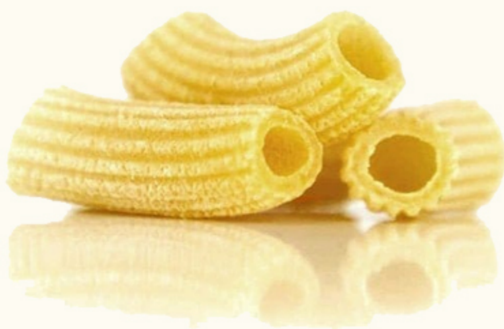
Tortiglioni o Rigatoni 10mm